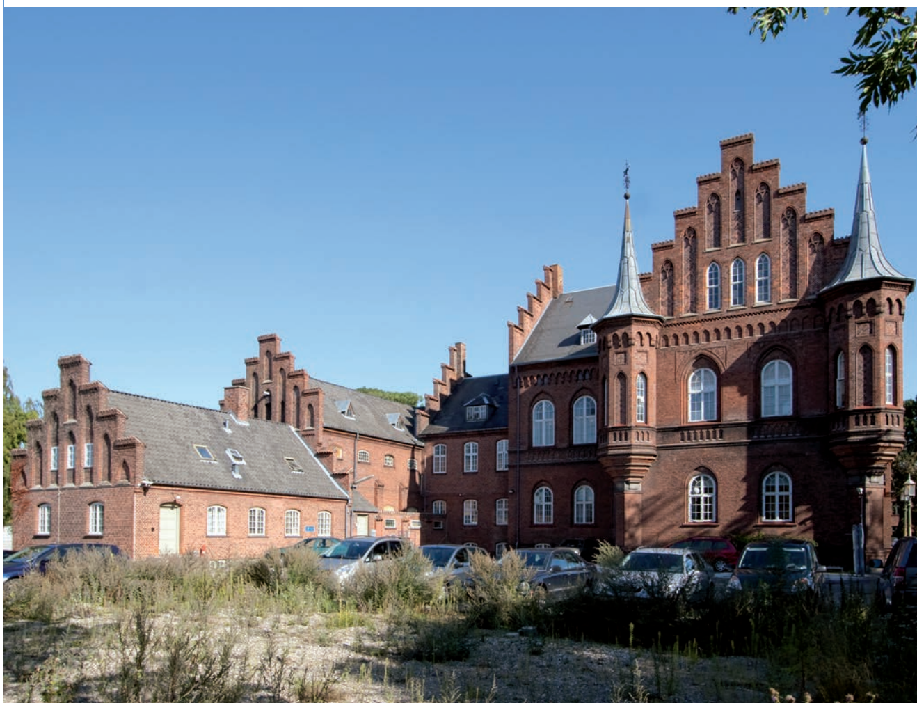
Facade mod sydøst med den tidligere arrestforvarerbolig og arresten til venstre.