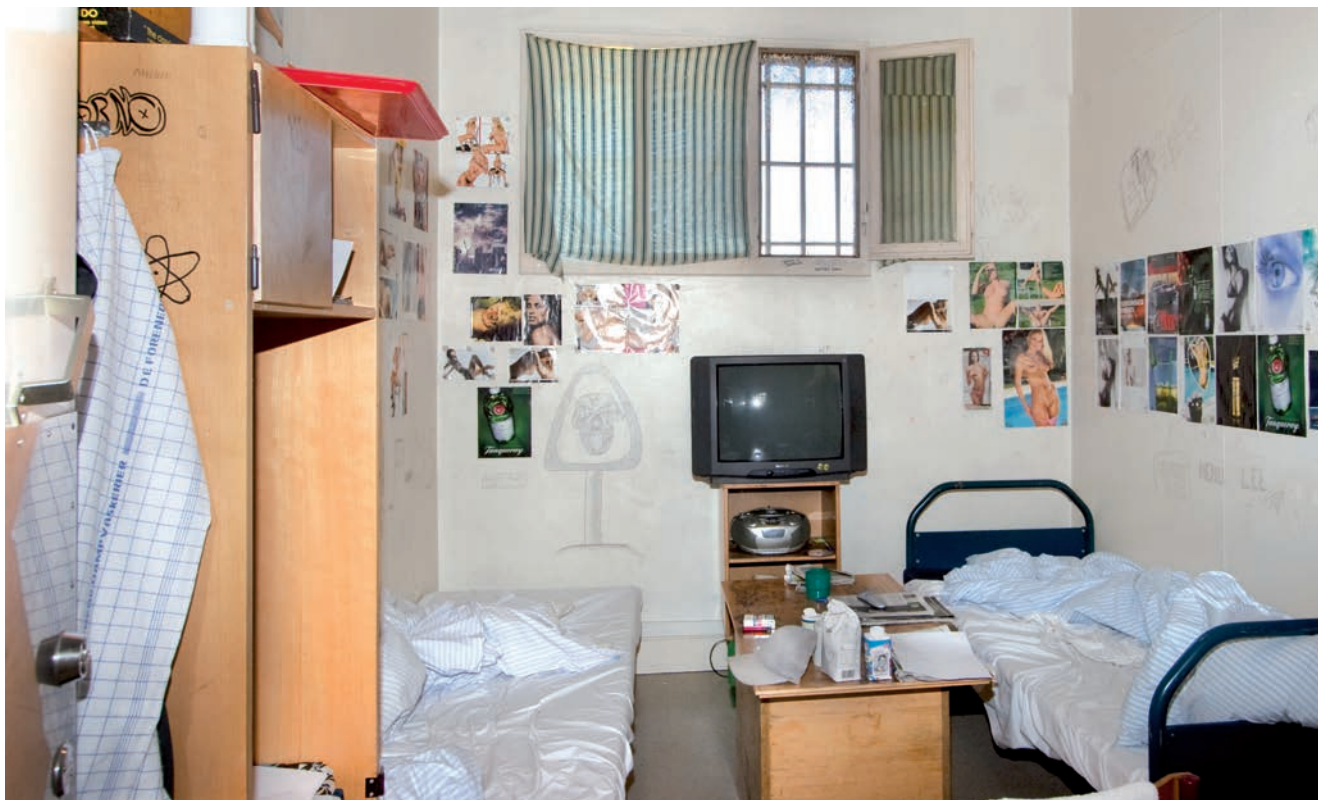
Dobbeltcelle, der er lidt større end en almindelig celle. 2-, 3- og 4-mandsceller er i vid udstrækning nedlagt i de senere år, men det er ikke svært at finde indsatte, der vil bo på de »dobbeltpinde«, der endnu findes i en del arresthuse.