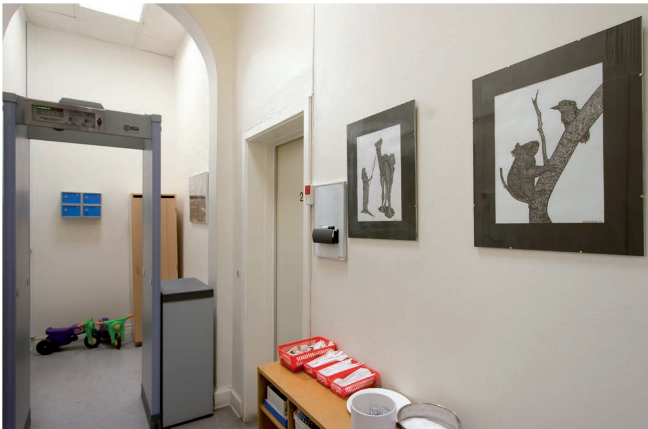
Besøgende og indsatte skal gennem en metaldetektorkarm før og efter besøg. En lignende karm står på første sal ved husets adgang til retten.

adskillige med livstids fængsel. Ud over overbelastningen – 13.383 divideret med 365 giver et gennemsnitstal på 36,7 mod en kapacitet på 23 – havde arresten en midlertidig afdeling på Skt. Jørgensbjerg.