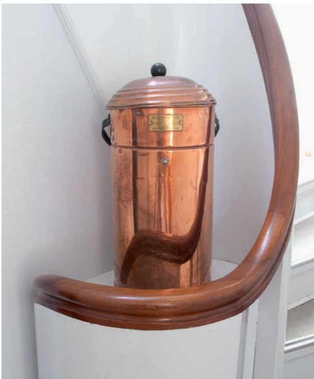
Alle arresthuse er udstyret med moderne brandmeldere og brandslukningsredskaber, men en gammel kobberbrandslukker er en dekorativ detalje i et gammelt hus.

at blive anholdt og fængslet, men derefter fortrød og flygtede blot ved at slå på dørene til hegnet, hvis nyligt udskiftede låse var alt for svage. Næsten tragikomisk i 1988, da en finne, der slap ud efter at have slået en fængselsbetjent ned, overså, at der var en meters højdeforskel mellem græsplænen og fortovet, tabte balancen og ramlede lige ind i en patrul-