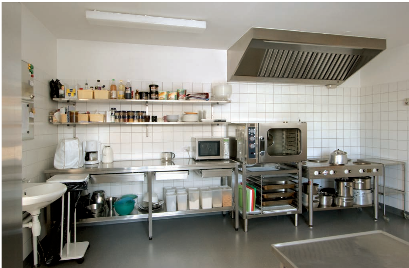
Som det eneste lille arresthus har Rønne stadig eget køkken og ikke frostmad, så alle kan lugte sig frem til, hvad der er på dagens menu.