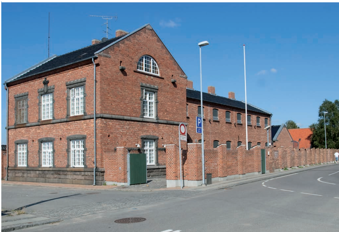
Arresthuset set fra Landemærket.