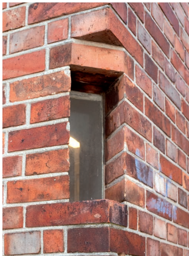
Bygningsdetalje fra Bidstrups arresthus med vindue til overvågning af gårdtur.

Ved jubilæet var der almindelig enighed om, at arresten er velrustet til de næste hundrede år.