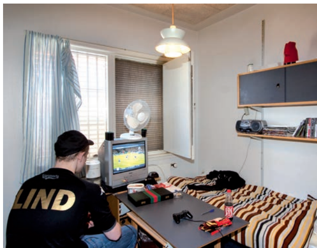
En nybygget celle med vindue i almindelig højde samt håndvask og toilet.

havde siddet tyve år forinden, men da han nægtede at tilstå drabet, henflyttedes han til den mørke arrest, hvor en mat lysstråle trængte ind gennem et lille vindue under loftet, hvor der hverken var briks eller bord, luften var kold og rå og vandet drev ned ad murene. Han lænkedes endog til væggen, bundet ved arme og ben til ringen som en kalv i en slagtervogn. Han tilstår mordet efter et døgnlangt forhør, men trækker tilståelsen tilbage og hænger sig sluttelig i sin celle.