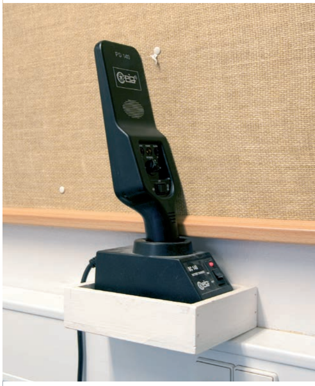
Håndscanner bruges i stedet for detektorkarm eller som supplement til denne.