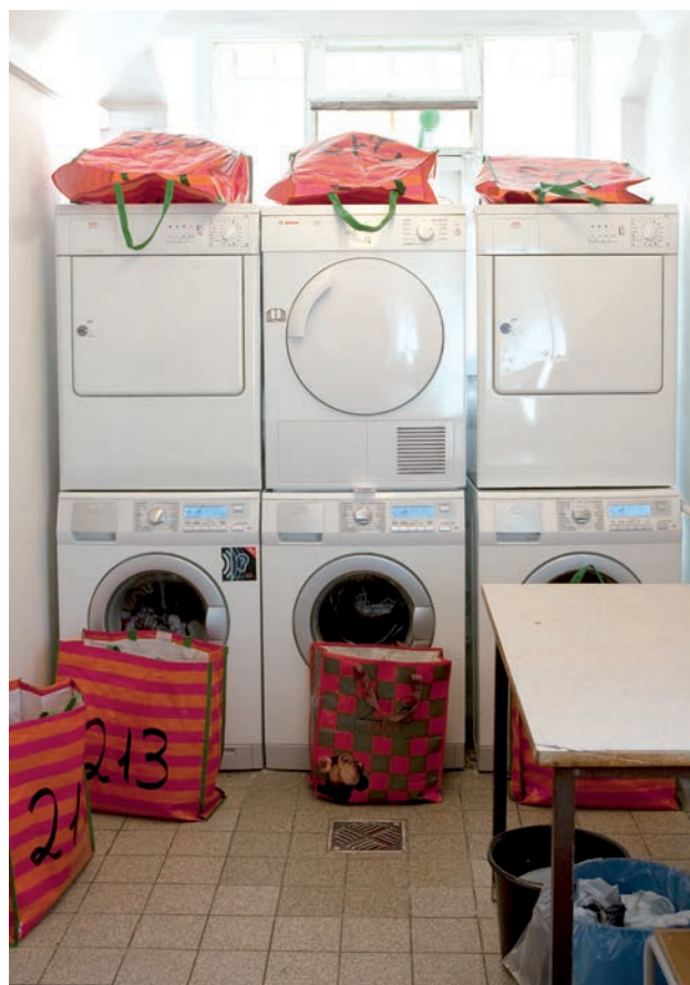
I arresthusene har de indsatte mulighed for at få vasket deres private beklædning.

Kapaciteten var i mange år 55 (46 enkeltceller og 3 tremandsceller), hvilket klart var for lidt. I 1994 var det daglige gennemsnit 56,5, altså over hundrede procent belægning, og når der var fuldt hus, måtte besøgsrum og venterum tages i brug og udstyres med feltsege. Efter den seneste ombygning er kapaciteten 69 (65 enkeltceller og 2 dobbeltceller), hvilket gør arresten til den største provinsarrest, på linie med Helsingør. Udnyttelsesprocenten i 2009 var 94,0.