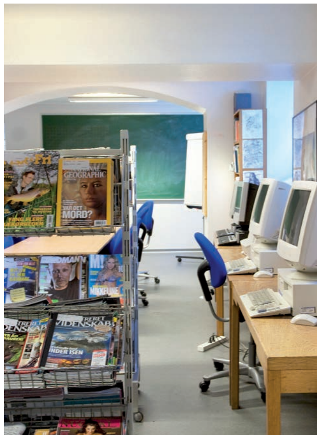
Bibliotek, undervisningslokale og datarum. Lokalet anvendes også som fritidsrum for de indsatte og til såkaldt forbehandling. Kriminalforsorgen betaler kommunerne for at drive arresthusenes biblioteker.