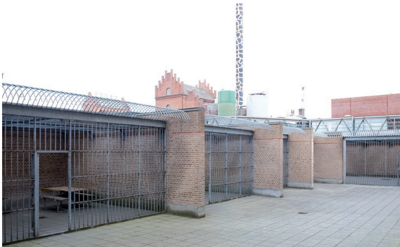
Gårdtursarealet. I baggrunden Albanibryggeriet med to fynske ikoner; bryghusets kamtakkede gavle og Girafølskorstenen.

Ved gentagne renoveringer i efterkrigsårene er bl.a. opført en ny arrestforvarerbolig, hvorefter den gamle bolig har kunnet inddrages til kontor og personalelokaler. Denne nyere bolig er i øvrigt nedrevet i slutningen af 1990-erne i forbindelse med opførelsen af en helt ny vinkelfløj med indgangsparti, personalekontorer, besøgslokaler m.v. samt nye gårdtursarealer, hvor de tidligere ni trekantede gårde, som Odense