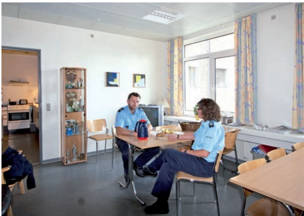
Som et af de få arresthuse har Arresthuset i Odense et veludstyret personalerum med spisestue og et lille køkken.

havde bevaret som et af de sidste arresthuse og af arrestforvareren betegnedes som kummerlige og ikke menneskeværdige, nu erstattedes af færre og større gårde med så højt til loftet, at der kunne spilles boldspil. Der er dog ikke blot bygget nyt, men også fjernet en tidligere bestående forbindelsesmur mellem sydøstgavlen og ydermuren, fordi denne var brugt til en flugt over ydermuren. En ikke fjernet murstump minder stadig om episoden.