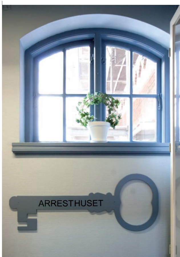
Selvom der er blomster og ingen tremmer for vinduet, er man ikke i tvivl om, hvor man er.