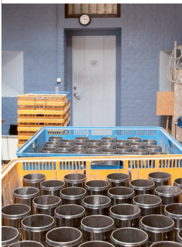
Metalemner forarbejdes på værkstedet og sendes videre til kunden.

Efter disse rædsler gør det helt godt at se, at der den 3. december 1912 ikke var en eneste arrestant, det har vel været den eneste gang, og at læse bespisningsreglementet for sunde fanger af 1915, hvor udgangs-