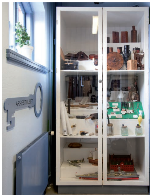
Flere arresthuse har samlinger og små museer. Arresthuset i Nakskov har bl.a. hjulpet med genstande til arresthusmuseet i Faaborg.

Forræderen Ebbe Ulfeldt , en svoger til Corfitz Ulfeldt, der var taget til fange under Anden Svenske-