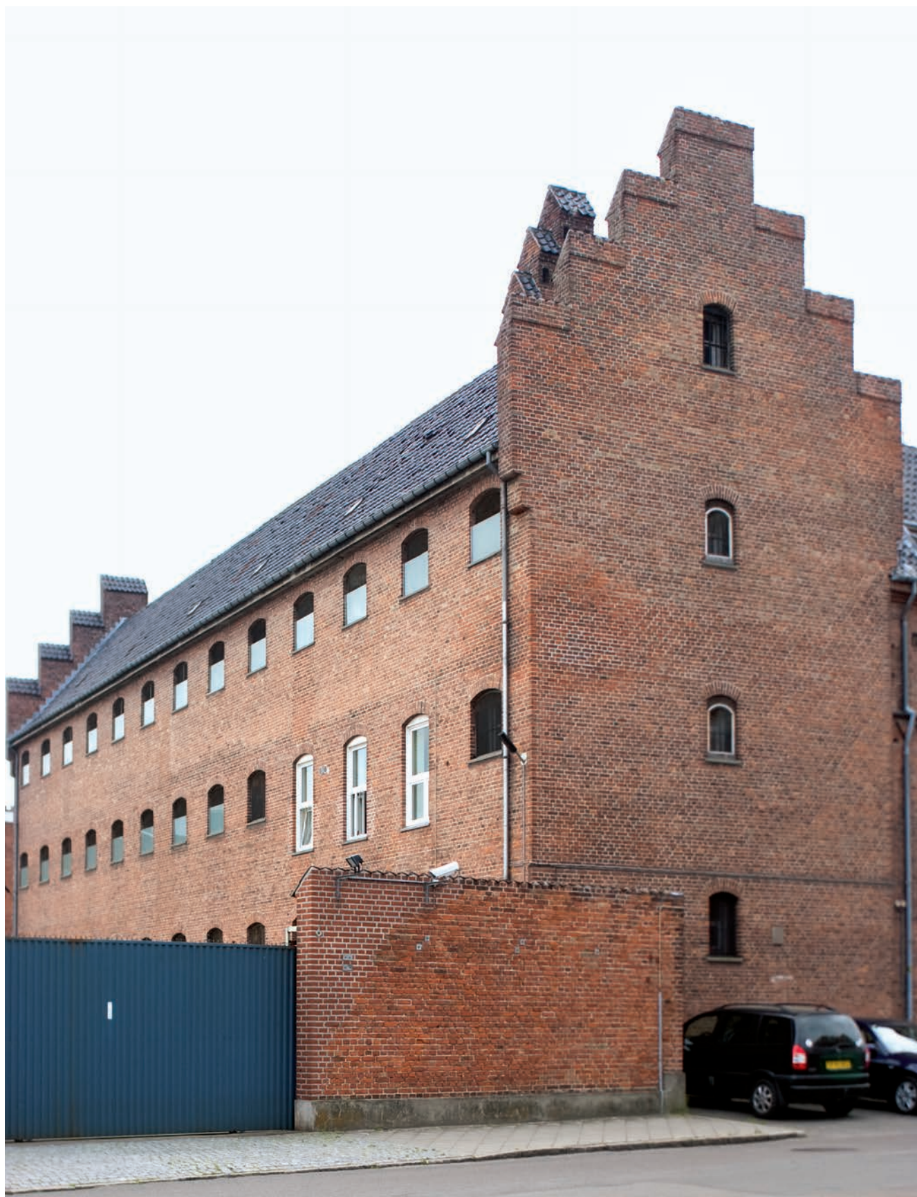
Arresthusets kapacitet er i dag 24 pladser i en bygning fra 1921.