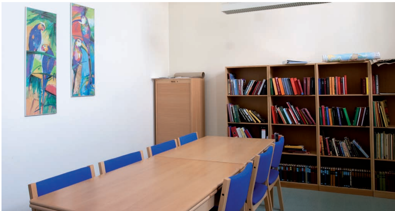
Skolestue med bogsamling fra folkebiblioteket og egne bøger. Bøgerne skiftes regelmæssigt og indsatte kan bestille de bøger, de ønsker, hos personalet. Hver torsdag kommer bibliotekaren.