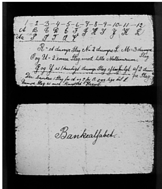
Bankesignaler har altid været brugt i fængsler og arresthuse. Her er et såkaldt bankealfabet på en opslagstavle i Køge Museums arkiv.