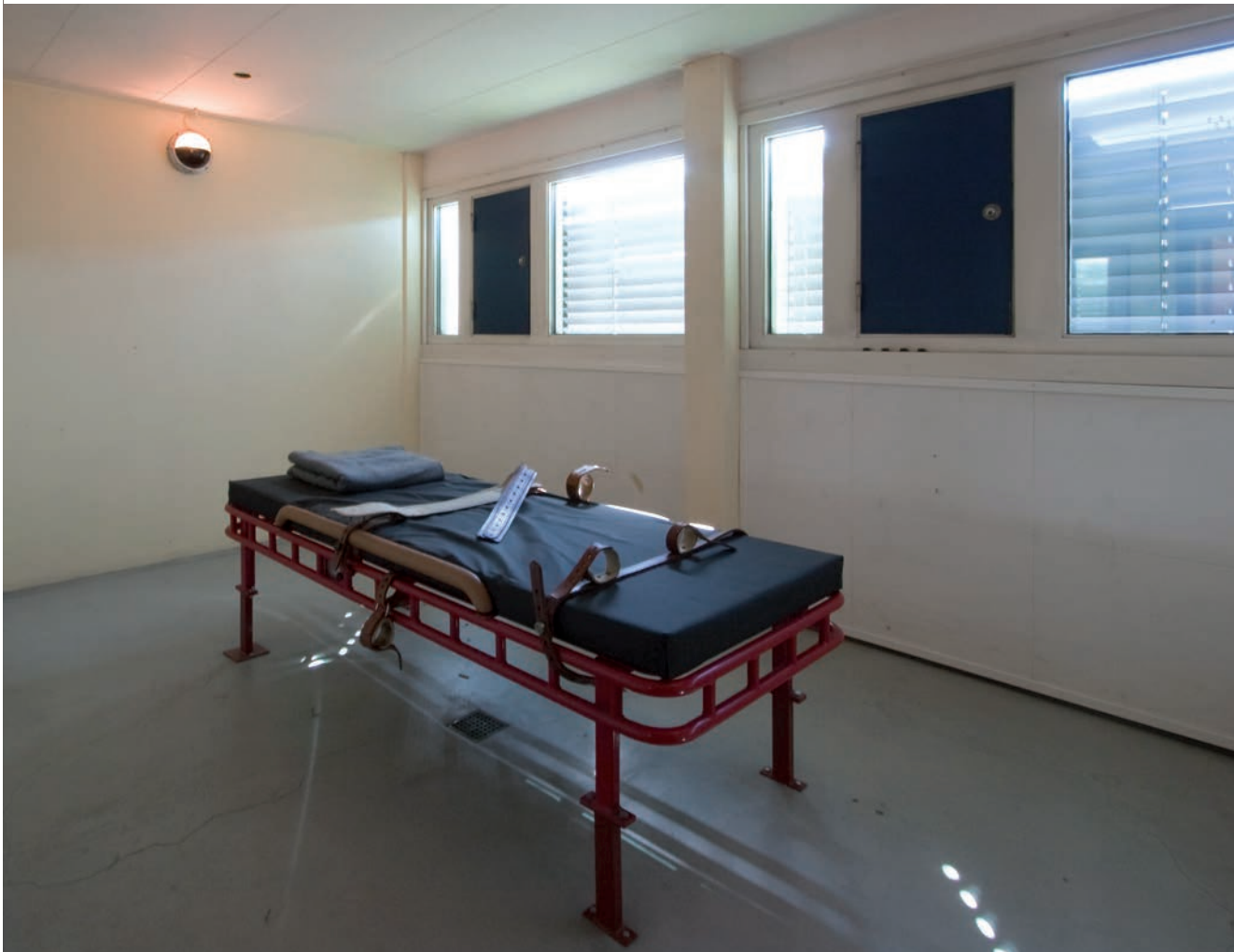
Som et af otte arresthuse er Køge udstyret med sikringscelle. Arresthuse med sikringscelle kan modtage indsatte fra andre institutioner. I 2009 var der i Køge 18 anbringelser i sikringscelle.