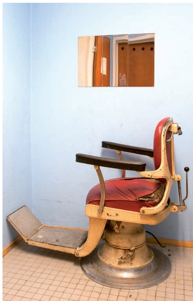
Langt fra alle arresthuse har en sådan imponant barberstol, men alle indsatte i arresthusene kan blive klippet, selvom de må tage til takke med en almindelig cellestol.

Fangeflugt er den evige bekymring. I 1976 nævnte arrestforvarer Ermstrand stolt, at først ved fjerde