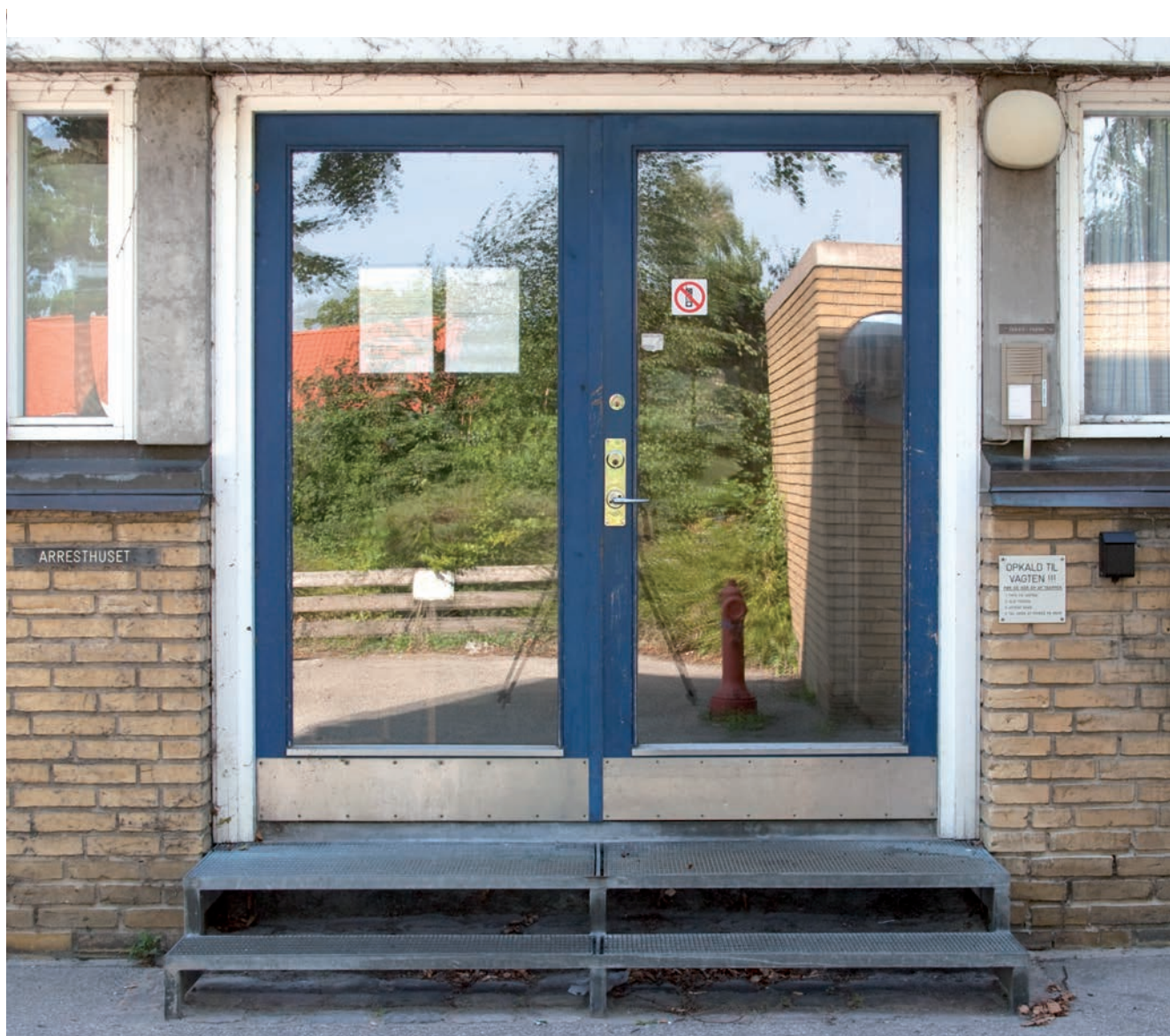
Publikumsindgangen til arresthuset.