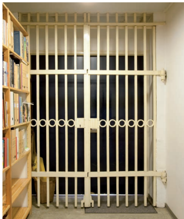
Den gamle gitterdør indgår nu i sikkerheden i Køge Museums arkiv.