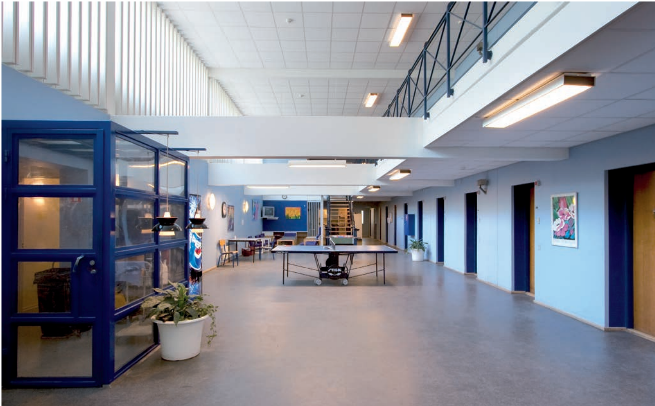
Cellegang med sluse fra celleområdet til kontorer, besøg mv.

gere flugten. Også luftlamellerne i cellerne var et ømt punkt. Mere sørgmuntret hører vi i 2002 om fangen, der stak af og tog en taxa, men anholdtes i Ishøj og førtes tilbage til arresten, men fik lov til at betale taxaen først. Og lad os ikke glemme fangen, der i 1977 overraskedes i et træ, da det begyndte at dryppe fra dette.