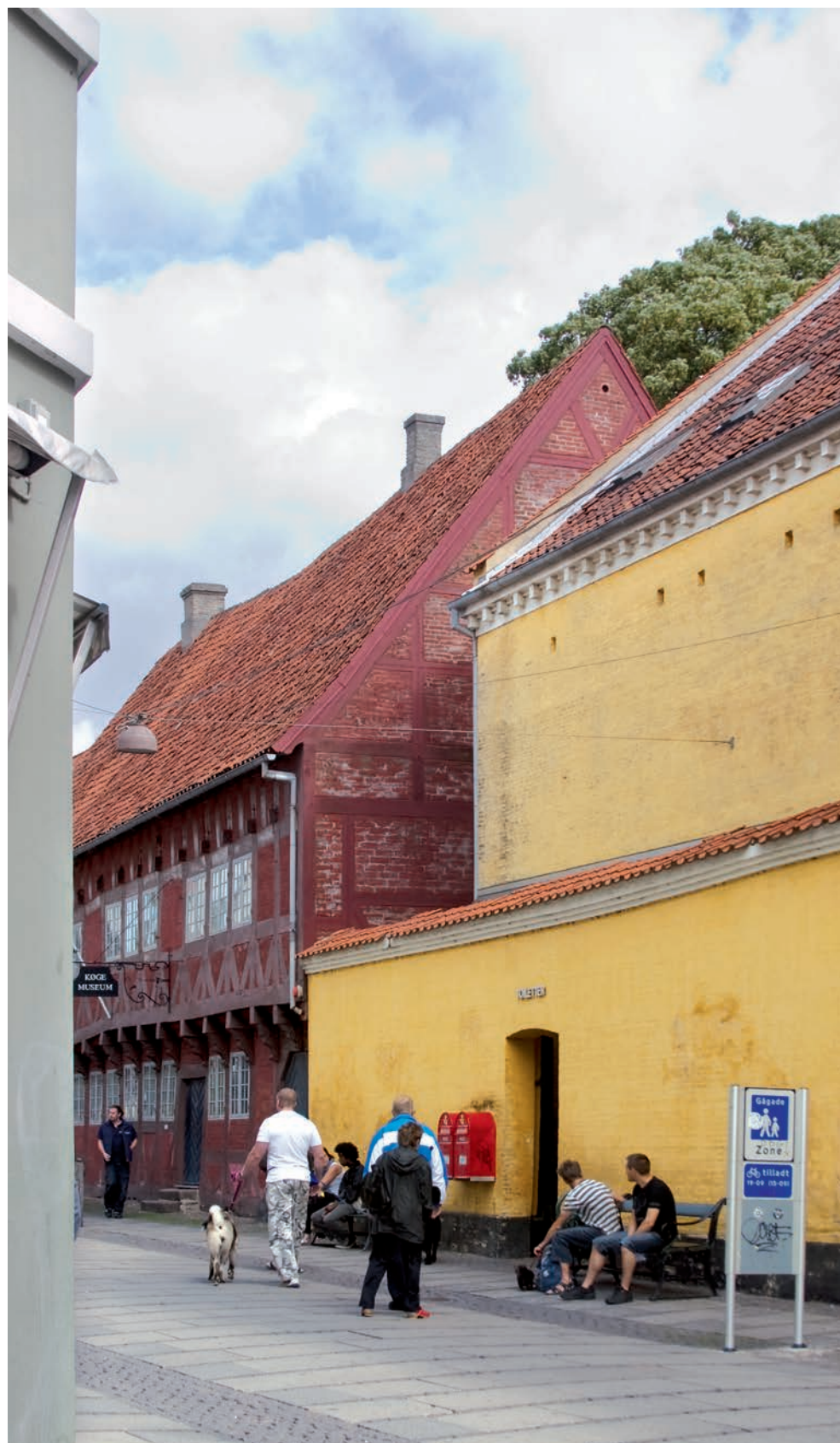
Det gamle arresthus rummer nu kontor og arkiv for Køge Museum. Der er i dag offentlige toiletter i stueetagen!