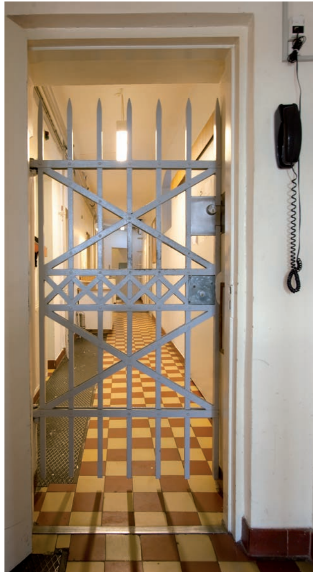
Gitterdør med svartelefon til de indsattes brug. Hvis den indsatte har tilladelse til telefonering, foretages opkaldet af personalet fra en anden telefon og omstilles til den indsatte.