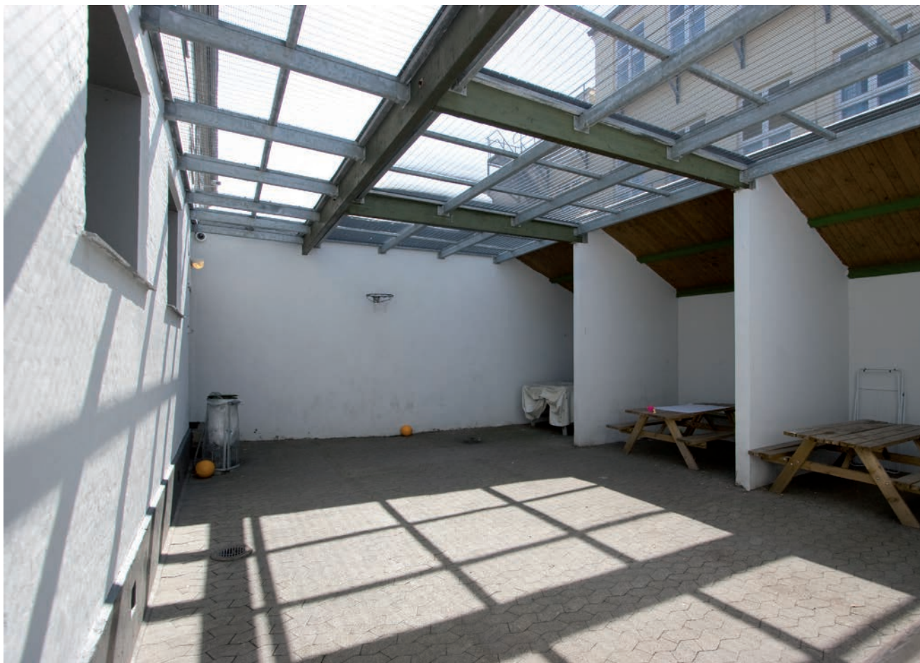
Gårdtursarealet til fællesgårdtur.