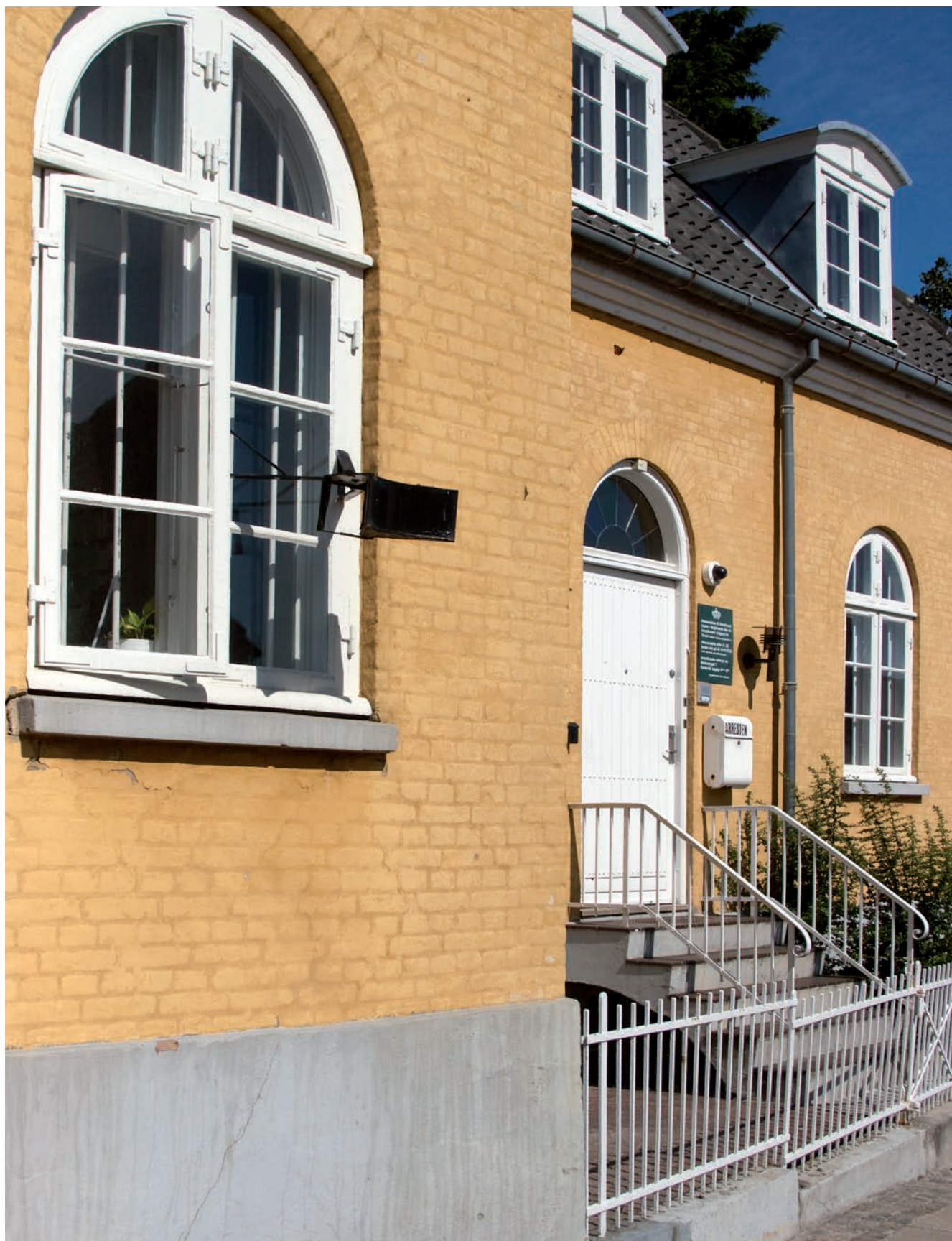
Indgangen til den gamle arrestforvarerbolig, der nu bruges til arresthusformål.