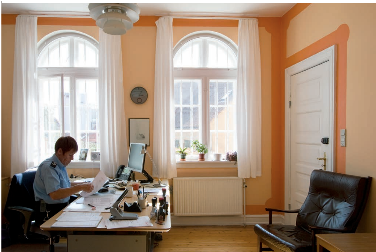
Arrestforvarerens kontor i den gamle bolig.

Omkring år 1800 var de værste rædsler på retur, særlig efter en statslig ordre af 1793 om indretning af arresterne således, at fangernes helbred ikke skadedes, men nød og sult under langvarig arrest hørte sta-