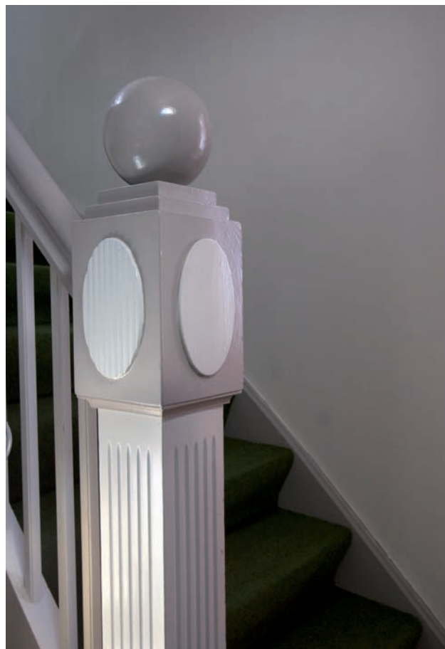
En gammel trappepost.

Kapaciteten er ikke meget ændret siden opførelsen. I dag er den 15. I 2009 var udnyttelsesprocenten 92,9.