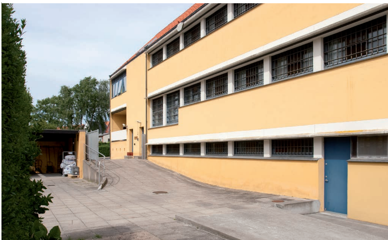
Vestfacade med kældervinduer til værksteder og cellevinduer i 1. og 2. etage. Længst borte den tidligere arrestforvarerbolig, der nu er indrettet til kontorer og overnatningskvarter til personale, der gør døgntjeneste.