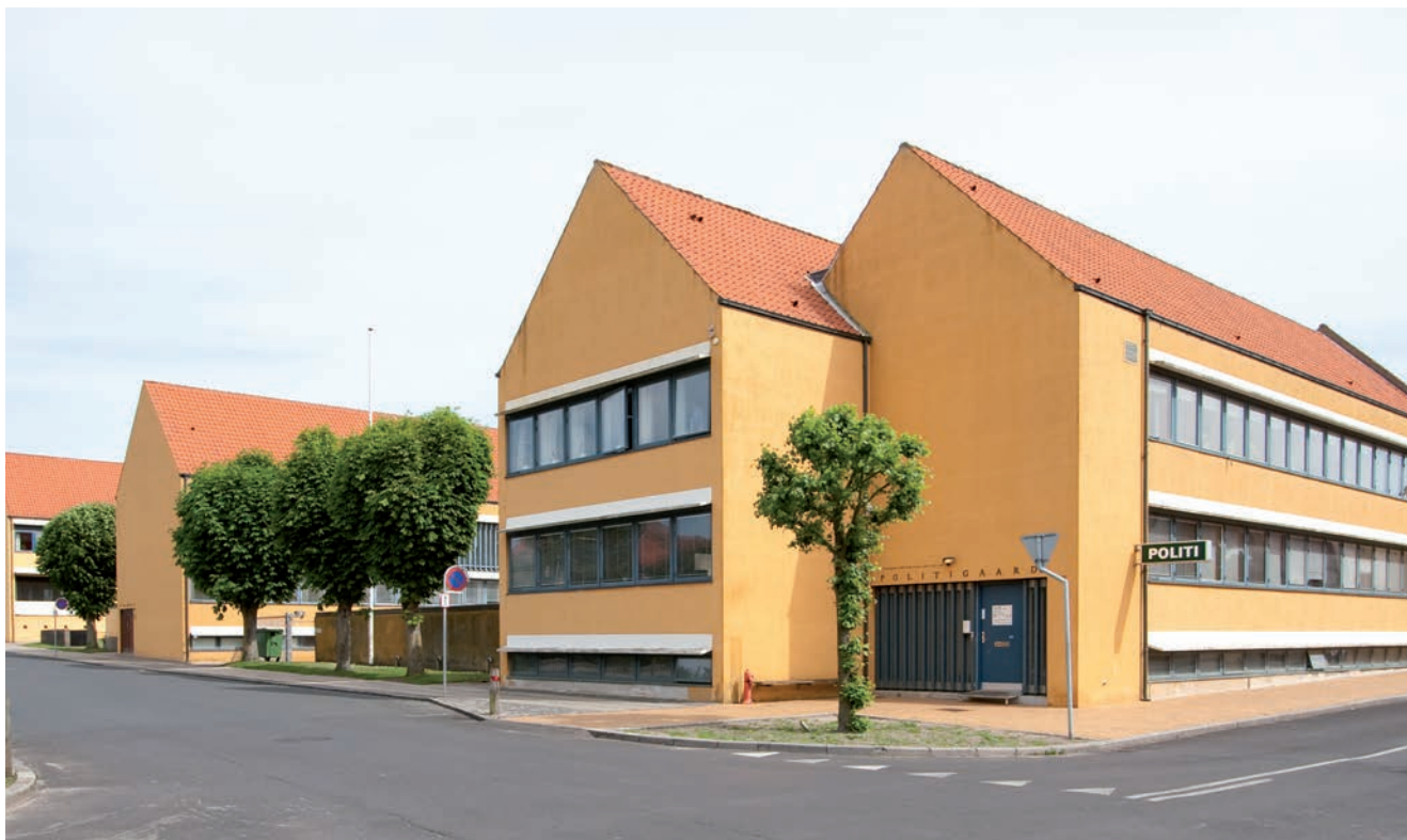
Ved opførelsen af det nye arresthus i 1969 anvendte man stadig »Treenighedsprincippet«. I forgrunden politistationen, i midten tinghuset og længst borte arresthuset.

de sidste fanger i portarresten var den berygtede morder, falskmøntner og kirketyv Jens Boye, halshugget i 1858 for rovmord på en husmand i Broendehus i Wedellsborg birk. Ved kgl. resolution fritoges han dog for hjul og støjle. 1859 nedbrødes Strandporten som den sidste af Assens' gamle byporte og den sidste rest af Assens' befæstning, i det 19. århundrede var der ikke megen sans for bygningsfredning.