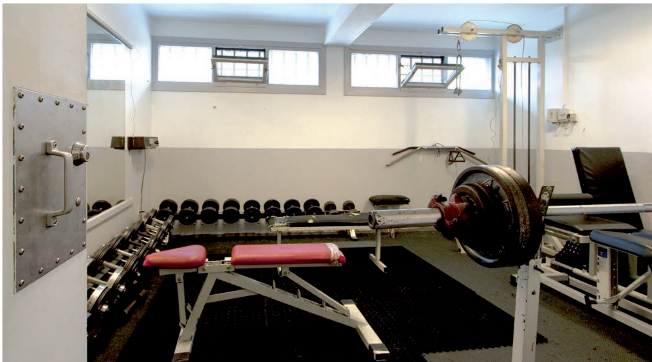
Det veludstyrede motionsrum i kælderen.