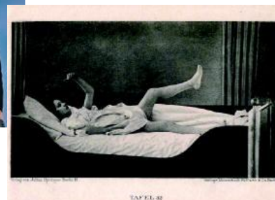
Katalepsi: en kataton tilstand, hvor abnorm kropsholdning fastholdes.