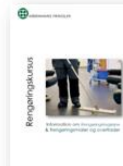
Rengøringskursus - information om Rengøringshygiejne & Rengøringsmidler og overflader