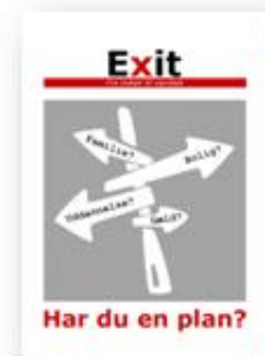
Exit - fra indsat til værdsat