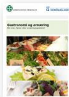
Gastronomi og ernæring - bliv kok, tjener eller ernæringsassistent