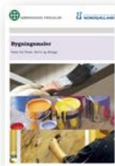
Bygningsmaler - sans for form, farve og design