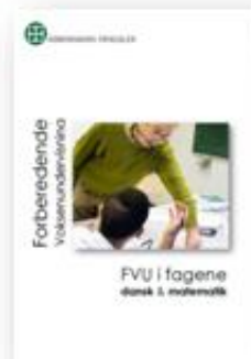
Forberedende Voksenundervisning - FVU i fagene dansk & matematik