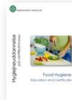
Hygiejneuddannelse - på certifikatniveau