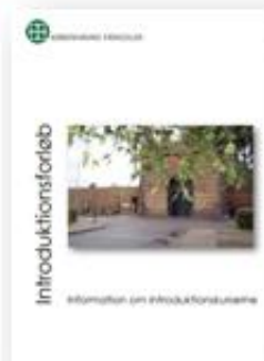
Introduktionsforløb - information om introduktionskurserne