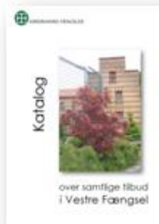
Katalog - over samtlige tilbud i Vestre Fængsel