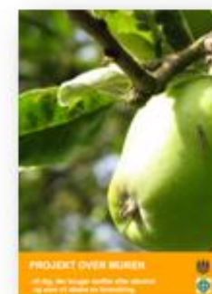
Projekt Over Muren - til dig, der bruger stoffer eller alkohol og som vil skabe en forandring